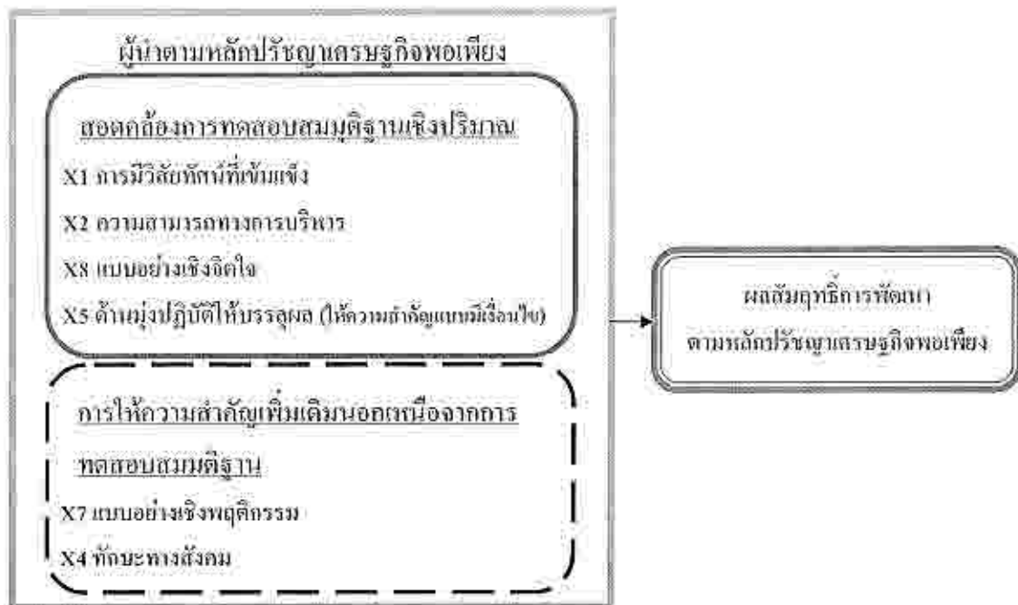
ภาพที่ 3 แสดงความสอดคล้องของผลการวิจัยเชิงปริมาณและผลการสัมภาษณ์

จากภาพที่ 3 กรอบด้านซ้ายแสดงสัมภาษณ์เชิงลึก คุณลักษณะของผู้นำตามหลักปรัชญาเศรษฐกิจพอเพียง ประกอบด้วย ชุดตัวแปรที่มีความสอดคล้องกับการทดสอบสมมติฐานเชิงปริมาณปรากฏดังกรอบด้านบน และชุดตัวแปรที่มีความสำคัญเพิ่มเติม นอกเหนือจากการทดสอบสมมติฐานปรากฏดังกรอบด้านล่าง ดังนั้นเห็นได้ว่าจากผลการสัมภาษณ์เชิงลึกมี 2 ปัจจัยเพิ่มที่มีความสำคัญต่อการพัฒนาตามหลักปรัชญาเศรษฐกิจพอเพียง คือ X7 แบบอย่างเชิงพฤติกรรม X4 ทักษะทางสังคม