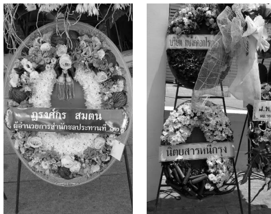
ภาพที่ 13 พวงหรีด ผู้เขียนถ่ายเมื่อวันที่ 3 พฤษภาคม 2559

ในจำนวนนี้ พวงหรีดดอกไม้สดได้รับความนิยมมากที่สุด ราคาเฉลี่ยอยู่ระหว่าง 500 – 3,000 บาท พวงหรีดดอกไม้ประดิษฐ์ชนิดแห้งราคาย่อมเยากว่าอยู่ระหว่าง 500 – 1,500 บาท ส่วนพวงหรีดดอกไม้ประดิษฐ์ชนิดสด มีผู้นิยมน้อยที่สุด แต่ราคาสูงเพราะทำยาก ต้องสั่งทำล่วงหน้า ราคาเฉลี่ยอยู่ระหว่าง 2,000 – 3,000 บาท