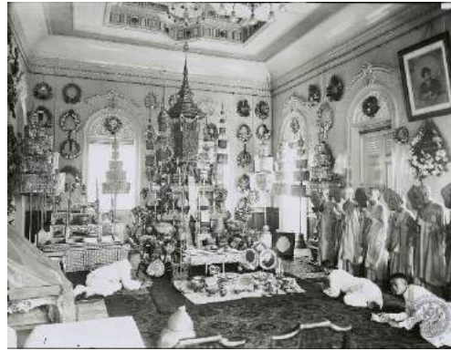
ภาพที่ 11 หมายเลข 56M 00048

ดอกไม้ประดิษฐ์ชนิดหนึ่งที่นิยมนำมาตกแต่งพวงหรีด มักทำจากแกนในของต้นระกำและแกนในของต้นโสน และทำจากกระดาษ เช่น กระดาษย่น กระดาษทองอังกฤษ สำหรับต้นระกำซึ่งเป็นพืชที่ขึ้นเฉพาะบริเวณใกล้ทะเลจึงมีแหล่งขายที่บ้านดอกไม้ (บริเวณเสาชิงช้า) ดังที่ระบุไว้ในหนังสือชื่อวิชาอาชีพชาวสยาม จากหนังสือจริยฐานวิเศษ ร.ศ. 108-113 (พ.ศ. 2433 – 2438 รัชสมัยรัชกาลที่ 5 - ผู้เขียน) ว่า “...ไปซื้อเปลือกกระกำที่พวกบ้านดอกไม้เขาปอกเอาใส่ในใช้ทำดอกไม้ แล้วเก็บเอาเปลือกไว้ขาย เป็นราคา 3 มัด สลึง...” (Fine Arts Department, 2011, p. 167) บ้านดอกไม้จึงเป็นแหล่งขายดอกไม้ประดิษฐ์จากไส้ระกำ และมีไส้ระกำขายแก่ผู้ซื้อไปทำดอกไม้ใบไม้ประดิษฐ์เองด้วย