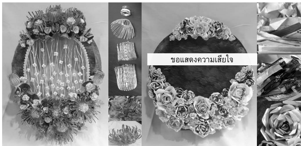
ภาพที่ 14 พวงหรีดจากวัสดุเหลือใช้เมื่อวันที่ 28 มิถุนายน 2559

แนวทางที่สอง การนำวัสดุใช้แล้วมาตกแต่งพวงหรีดเพื่อสร้างมูลค่าเพิ่มแก่ผลิตภัณฑ์เชิงสร้างสรรค์ของชุมชน และเพื่ออนุรักษ์สิ่งแวดล้อม พวงหรีดตามแนวทางนี้จะนำเศษวัสดุที่ผ่านการใช้งานแล้วมาดัดแปลง (Reuse และ Recycle) ให้เป็นดอกไม้ไม้ใบไม้แล้วนำมาตกแต่งพวงหรีด เศษวัสดุเหล่านั้น เช่น กระดาษหนังสือพิมพ์ ถุงขนม ซองกาแฟ ขวดพลาสติก ฯลฯ การตกแต่งพวงหรีดด้วยวัสดุเหลือใช้จะช่วยลดขยะและของเสียจากการดำเนินกิจกรรมในชีวิตประจำวันและในงานพิธีกรรมต่างๆ ซึ่งนับวันจะมีปริมาณเพิ่มขึ้น นอกจากนี้ยังเป็นหนทางหนึ่งในการสร้างรายได้แก่ชุมชนด้วย