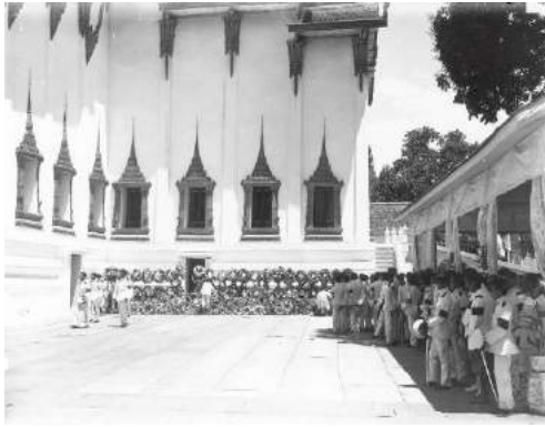
ภาพที่ 10 หมายเลข 56M 000065