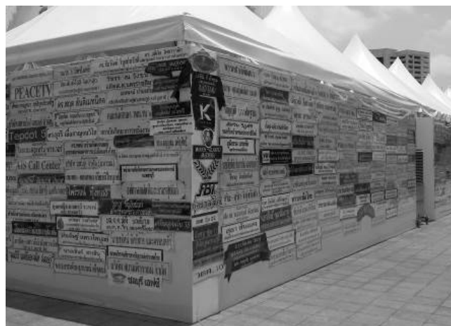
ภาพที่ 5 ผู้เขียนถ่ายเมื่อวันที่ 3 พฤษภาคม 2559