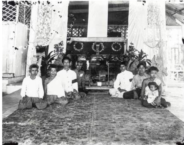
ภาพที่ 4 หมายเลข 56M 00006

ปัจจุบันปริมาณการใช้พวงหรีดเพื่อแสดงความไว้อาลัยในประเพณีงานศพของไทยเพิ่มขึ้นอย่างมาก และอย่างรวดเร็ว อาจกล่าวได้ว่าทุกวันนี้แทบทุกงานศพจะมีพวงหรีดมากบ้างน้อยบ้าง จำนวนพวงหรีดยังคงแสดงให้เห็นความสำคัญของงานศพเช่นเดิม เพราะเป็นที่รับรู้ว่าการเป็นงานศพของผู้มีชื่อเสียง (ที่ไม่งดรับพวงหรีด) จะมีพวงหรีดจำนวนมากจากผู้ร่วมงาน ตัวอย่างเช่น งานพระราชทานเพลิงศพนายบรรหาร ศิลปอาชา อดีตนายกรัฐมนตรี (30 เมษายน – 7 พฤษภาคม 2559) ณ ศาลา 1 วัดเทพศิรินทราวาสราชวรวิหาร กรุงเทพมหานคร จำนวนพวงหรีดมีมากจนเจ้าภาพไม่อาจหาที่แขวนได้เพียงพอ ต้องทำป้ายไม้ขนาดใหญ่หลายป้าย เพื่อติดกระดาษป้ายชื่อผู้ส่งพวงหรีดแสดงไว้อาลัย