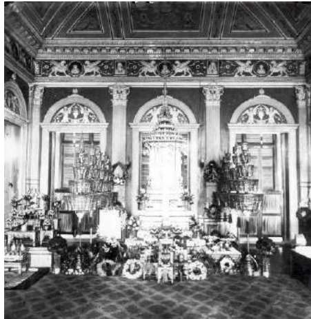
ภาพที่ 3 หมายเลข 56M 00013

จำนวนพวงหรีดในงานศพย่อมแสดงถึงฐานะของครอบครัวผู้วายชนม์ด้วย งานศพของชนชั้นสูงจะมีจำนวนมากกว่างานศพของสามัญชน ตัวอย่างเช่น งานพระศพเจ้านาย (ไม่ทราบพระนาม) จัดพิธีที่วังบูรพาภิรมย์ มีพวงหรีดมากกว่า 20 พวง จัดแขวนที่ฝาผนัง 4 พวง ที่เหลื่อวางบนพื้นหน้าพระโกศ (Picture No. 56M 00013) ขณะที่พวงหรีดในงานศพสามัญชน (ไม่ทราบชื่อ) มีพวงหรีดประดับบนหีบศพ 3 พวงเท่านั้น (Picture No. 56M 00006) และจากภาพงานศพหลายงานพบว่าพวงหรีดจะถูกย้ายไปประดับบริเวณเมรุในเวลาอุปการกิจศพ พวงหรีดจึงช่วยสร้างสีสันแก่งานศพนับแต่เริ่มจนจบงาน