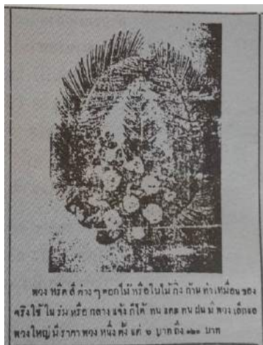
ภาพที่ 12 เอนก นาวิกมูล (2531) จากหนังสือโฆษณาไทยสมัยแรก

“พวงหรีดสีต่างๆ ดอกไม้หรือใบไม้กิ่งก้านทำเหมือนของจริงใช้ในร่มหรือกลางแจ้งก็ได้ ทนแดดทนฝน มีพวงเล็กและพวงใหญ่ มีราคาพวงหนึ่งตั้งแต่ 6 บาท ถึง 120 บาท (Nawigamune, A., 1988, p. 153)