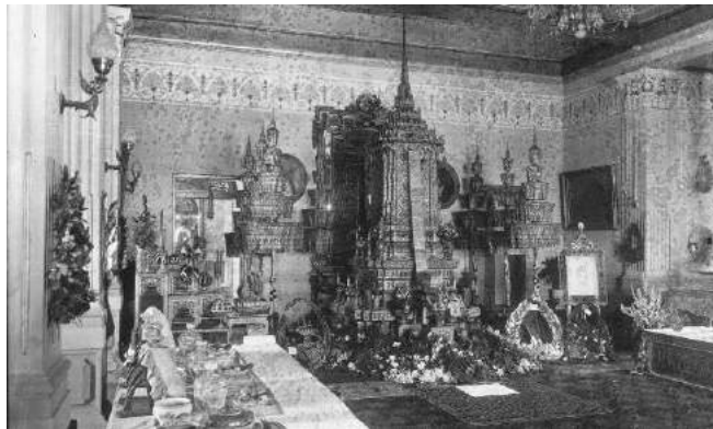
ภาพที่ 6 หมายเลข 56M 00023 งานพระศพกรมหมื่นราชศักดิ์สโมสร (พ.ศ. 2474)

ตามธรรมเนียมของชาวตะวันตกที่เป็นต้นตำรับพวงหรีด เมื่อส่งพวงหรีดไปแสดงความไว้อาลัย จะมีกระดาษแผ่นเล็กๆ หรืออาจเป็นนามบัตรระบุชื่อผู้ส่งติดไปด้วย เพื่อเจ้าภาพจะได้รู้ชื่อผู้ส่งและตอบขอบคุณได้สำหรับพวงหรีดที่ปรากฏในภาพถ่ายงานศพของคนไทยในอดีต หากเป็นงานศพของชนชั้นสูงจะมีนามบัตรติดมาบ้างไม่ติดมาบ้าง แต่พวงหรีดในงานศพของสามัญชนไม่พบว่ามีนามบัตรติดมาเลย การไม่ติดนามบัตรอาจเป็นเพราะเจ้าภาพจัดหาพวงหรีดมาเอง และหรือผู้ส่งพวงหรีดเป็นผู้คุ้นเคยกันจนไม่จำเป็นต้องระบุชื่อก็มีความเป็นไปได้ทั้งสองเหตุผล (Picture No. 56M 00023)