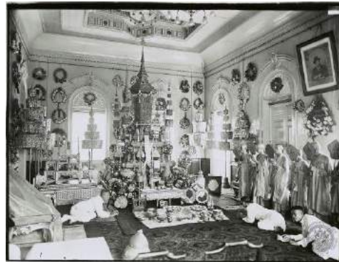
ภาพที่ 8 หมายเลข 56M 00048

การที่ดอกไม้สดหายากและมีน้อยชนิด คาดว่าพวงหรีดดอกไม้สดคงไม่เป็นที่นิยมมากนัก เพราะราคาอาจสูงแต่มีข้อด้อยอยู่มาก เช่น ชนิดของดอกไม้ซ้ำกัน เทียบง่ายไม่คงทนจนเสร็จพิธี นอกจากนี้อาจไม่ถูกรสนิยมของคนไทยในอดีตที่ชื่นชอบงานศิลปะประดิษฐ์ที่ประณีตบรรจงมากกว่าการนำดอกไม้ใบไม้มาเสียบบนโครงพวงหรีด โดยไม่ตัดแปลงแต่หลังจากที่มีผู้ปลูกหรือมีผู้นำเข้าดอกไม้มากขึ้น มีสถานที่จำหน่ายมากขึ้น และมีราคาย่อมเยาลง พวงหรีดดอกไม้สดจึงได้รับความนิยมเพิ่มขึ้นจนแทนที่พวงหรีดรูปแบบอื่น