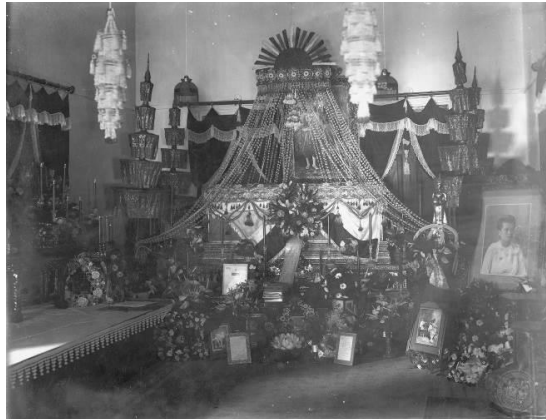
ภาพที่ 1 หมายเลข 56M 00050

ช่วงเวลาการรับพวงหรีดยังไม่อาจหาข้อยุติ แต่การรับเข้ามาใช้ได้ส่งผลให้ธรรมเนียมการไหว้ศพและการแสดงความไว้อาลัยต่อศพด้วยดอกไม้รูปเทียนถูกลดความนิยมจนแทบไม่ปรากฏให้เห็น อาจเพราะดอกไม้รูปเทียนที่ต่างคนต่างนำมาวางหน้าศพมีลักษณะเป็นช่อเป็นกำย้อมไม้เข้ากันทั้งขนาดและชนิดของดอกไม้ ต่างจากพวงหรีดที่ตกแต่งอย่างสวยงาม มีรูปแบบชัดเจนและมีความคงทน ไม่เหี่ยวเฉาง่าย นอกจากนี้ยังเป็นวัฒนธรรมตะวันตกที่ถือเป็น “ของนอก” ย่อมดูดี มีรสนิยมมากกว่าของเดิม และยังเป็นเสมือนเครื่องนัฏการหรือเครื่องสักการะศพด้วย พวงหรีดจึงเข้ามาแทนที่และเข้ามาเสริมธรรมเนียมปฏิบัติในงานศพอย่างลงตัว ความนิยมใช้พวงหรีดจึงได้ แพร่หลายในหมู่ชนชั้นสูง ก่อนจากนั้นจึงแพร่หลายสู่สามัญชน