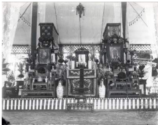
ภาพที่ 2 หมายเลข 56M 00010

นอกจากนำมาเคารพศพแทนดอกไม้รูปเทียนแล้ว พวงหรีดได้ใช้เป็นเครื่องตกแต่งหน้าศพหรือบริเวณงานศพ เนื่องจากพวงหรีดเป็น “ของนอก” การมีพวงหรีดในงานศพจึงสร้างความภูมิใจแก่เจ้าภาพ ช่วงที่พวงหรีดเป็นที่รู้จักในวงแคบ คงมีผู้นำมาแสดงความไว้อาลัยไม่มาก เจ้าภาพต้องจัดหาเองเพิ่มเติมหรือบางงานอาจหาเองทั้งหมด โดยพิจารณาจากพวงหรีดที่มีการตกแต่งเหมือนกัน หรือการจัดวางพวงหรีดที่ลงตัวพอดี ตัวอย่างเช่น งานศพชายและหญิงสูงอายุไม่ทราบชื่อ พิจารณาจากการจัดสถานที่น่าจะมีฐานะ ร่ำรวย เจ้าภาพแขวนพวงหรีดไว้ที่หีบศพ หีบละ 1 พวง (Picture No. 56M 00010)