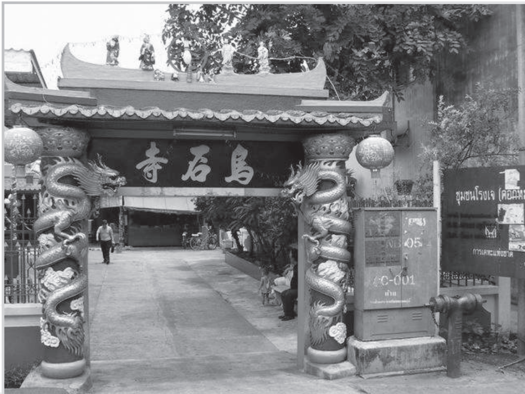
ศาลาภิรมย์ภักดี ๑๓๑ บริเวณริมคลองบางหลวง