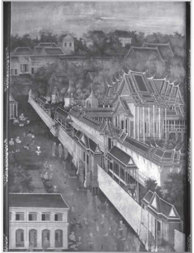
หลักมหาสิมาวัดโพธิ์นิมิตสถิตมหาสิมาราม และภาพจิตรกรรมฝาผนังภายในพระอุโบสถ