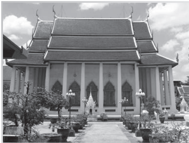
พระอุโบสถวัดอินทาราม

ส่วนในเรื่องการจัดการด้านสิ่งดึงดูดใจอื่น ๆ ที่นอกเหนือจาก วัด ตึกเก่า การบริการด้านอาหาร ตลาดพลูยังขาดในเรื่องของงานเทศกาลประเพณีที่ยังไม่โดดเด่นและคนส่วนใหญ่ไม่รู้จักเช่นงานเทศกาลงานไหว้เจ้าแม่กิมบ้อ เป็นต้น