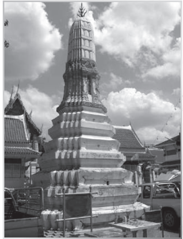
เขามอ และพระปรางค์บรมจุลธาตุพระยาพิชัยดาบหัก ภายในวัดราชคฤห์วรวิหาร