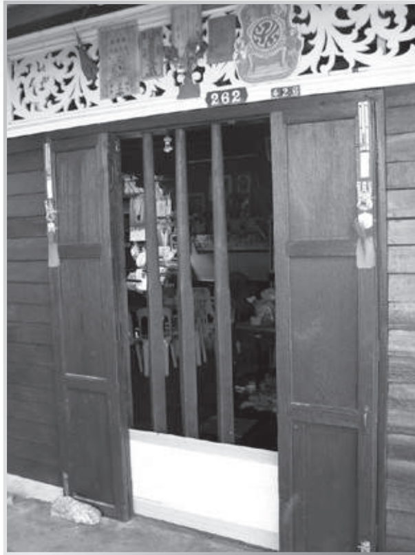
บ้านโบราณชุดประตูตะเกียบ