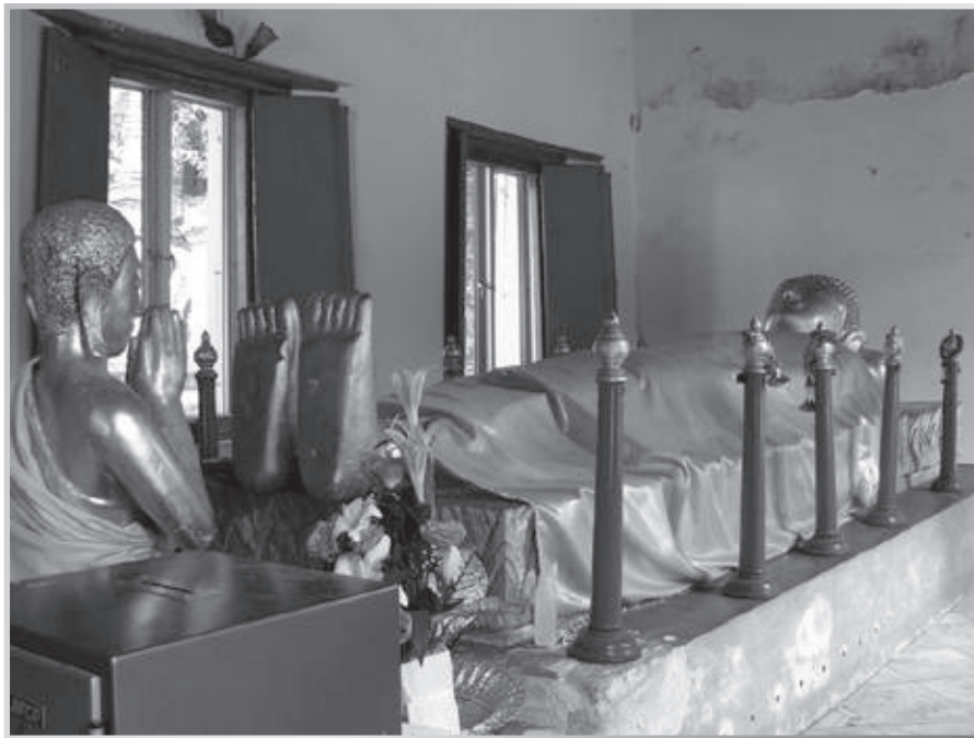
พระพุทธรูปปางถวายพระเพลิง ภายในวัดราชคฤห์วรวิหาร