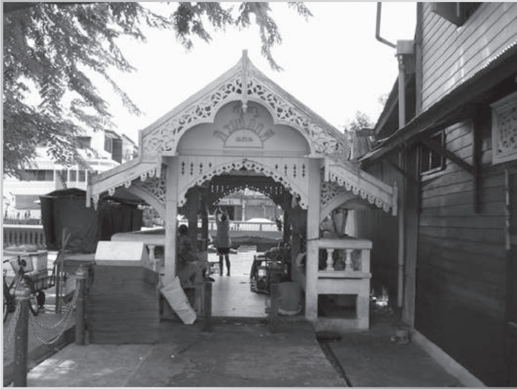
ศาลเจ้าโอวเจียหยี่อาเนี้ยเก็ง