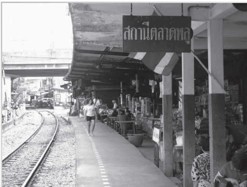
ภาพบริเวณชานชาลาสถานีรถไฟตลาดพลู