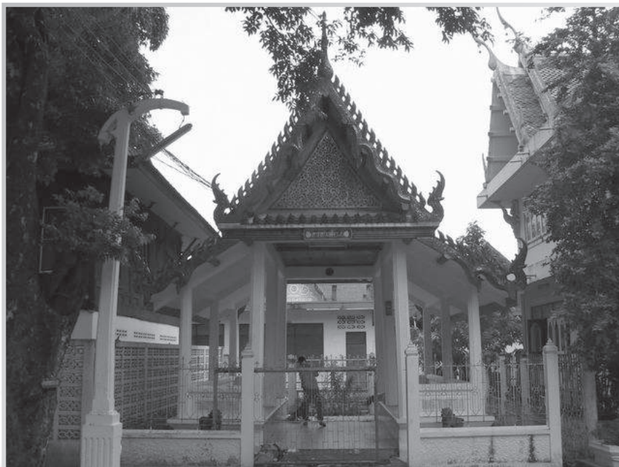
ศาลาทำเสด็จ ร.๕ บริเวณทำนน้ำภายในวัดโพธิ์นิมิตฯ