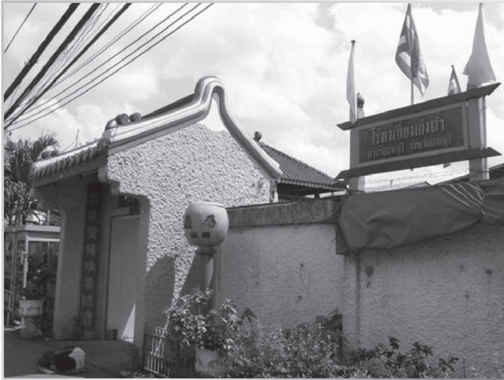
โรงเจเซียงเง่งตั่ว ซอยเทอดไท 21