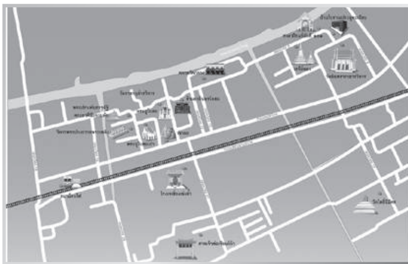
แผนที่แสดงเส้นทางท่องเที่ยวภายในชุมชนตลาดพลู

ชุมชนตลาดพลูสามารถบริหารจัดการการท่องเที่ยวด้วยตนเอง ผลการวิจัยสามารถนำไปปรับใช้เป็นแนวทางการจัดการแหล่งท่องเที่ยวอื่น ๆ ได้