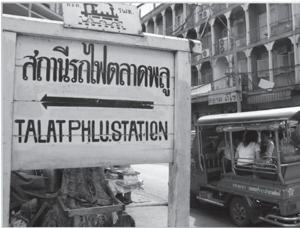
ภาพสถานีรถไฟตลาดพลู