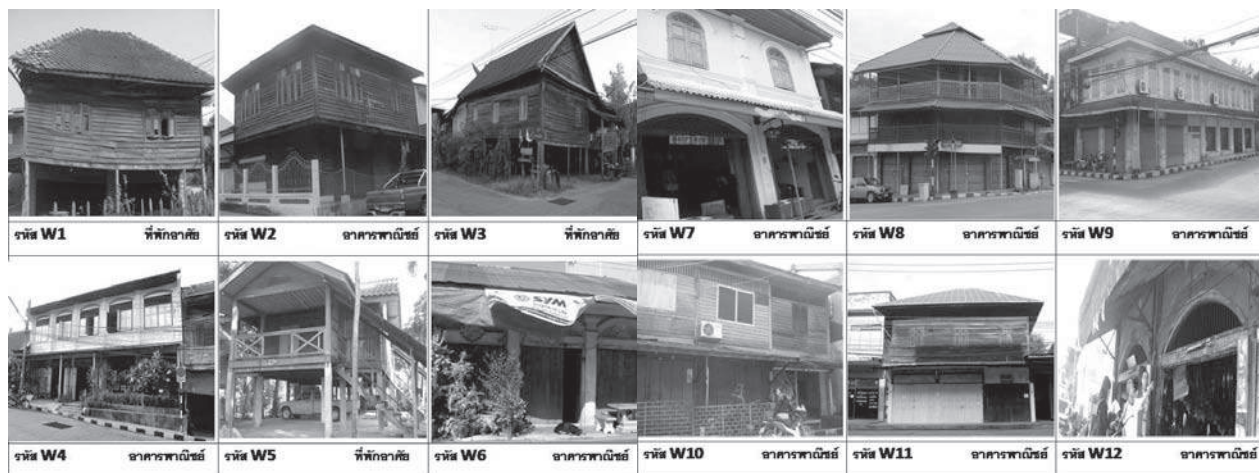
ภาพที่ 4 ชุมชนศูนย์กลางคมนาคมใหม่ กลุ่มอาคารในชุมชนถนนทหารเชื่อมต่อชุมชนรถไฟ

3) ชุมชนศูนย์กลางคมนาคมใหม่ หมายถึงชุมชนที่ประกอบไปด้วยที่อยู่อาศัยและตลาดที่ตั้งอยู่บนถนน มักอยู่ในพื้นที่ศูนย์กลางเมืองดั้งเดิมหรืออยู่ในพื้นที่เมืองเก่า เป็นชุมชนที่น่าจะมีต้นกำเนิดมาจากการเป็นศูนย์กลางหรือศูนย์รวมกิจกรรม (Node) การค้าที่อาศัยการเดินทางด้วยถนนและทางรถไฟเป็นหลัก แต่อยู่แบบกระจัดกระจาย ทั้งที่เป็นบ้านของเอกชน ศาสนสถาน อาคารพาณิชย์ แต่เมื่อมีการสร้างถนนและได้รับความนิยมนมากขึ้นจึงปรับตัวให้เข้ากับเส้นทางคมนาคมแบบใหม่ ได้แก่ ชุมชนถนนทหารเชื่อมต่อชุมชนรถไฟ ในเขตอำเภอวารินชำราบ