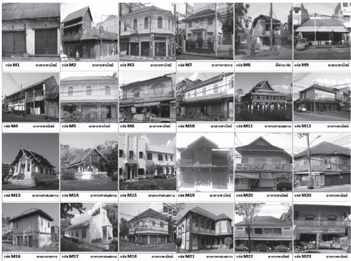
ภาพที่ 3 ชุมชนย่านการพาณิชย์ กลุ่มอาคารในชุมชนถนนหลวงอำเภอเมือง