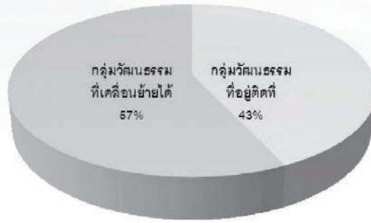
ภาพที่ 1 มรดกวัฒนธรรมที่จับต้องได้ในละครย้อนยุค