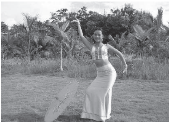
ภาพที่ 2 เครื่องแต่งกายชาวไต

หูหลูเซียว (葫芦箫húlúxiāo) หรือ หูหลูซือ (葫芦丝húlúsī) คือ ขลุ่ยน้ำเต้า เป็นเครื่องดนตรีประเภทเป่าชนิดหนึ่งที่เป็นเอกลักษณ์อันโดดเด่นของชาวไต ด้วยเสียงที่หวานใส และกังวาน ราวกับจะบอกให้รู้ว่าเป็นเสียงจากกลุ่มชนที่มีจิตใจซื่อตรง งดงามและบริสุทธิ์ของผู้คนเผ่าไต หากมีโอกาสเดินทางไปชมเทศกาลขนานอันเป็นที่อยู่ของชาวไต ก็จะได้ยินเสียงขลุ่ยน้ำเต้าอบอวนไปทั่วทุกมุมเมือง นอกจากจะเป็นเครื่องดนตรีประจำเผ่ากลุ่มน้อยชาวไตในสิบสองปันนาแล้ว ด้วยความไพเราะของขลุ่ยน้ำเต้า และความใกล้ชิดกันของกลุ่มชนเผ่าต่างๆ ทำให้มีการถ่ายทอดทางวัฒนธรรมกันมาตลอด ขลุ่ยน้ำเต้า จึงได้รับความนิยมชมชอบของชนเผ่ากลุ่มน้อยแถบภาคตะวันตกเฉียงใต้ของจีนอีกหลายกลุ่ม เช่น ชาวเผ่าอาซาง ชาวเผ่าว้า และชาวเผ่าจิ้งโพด้วย