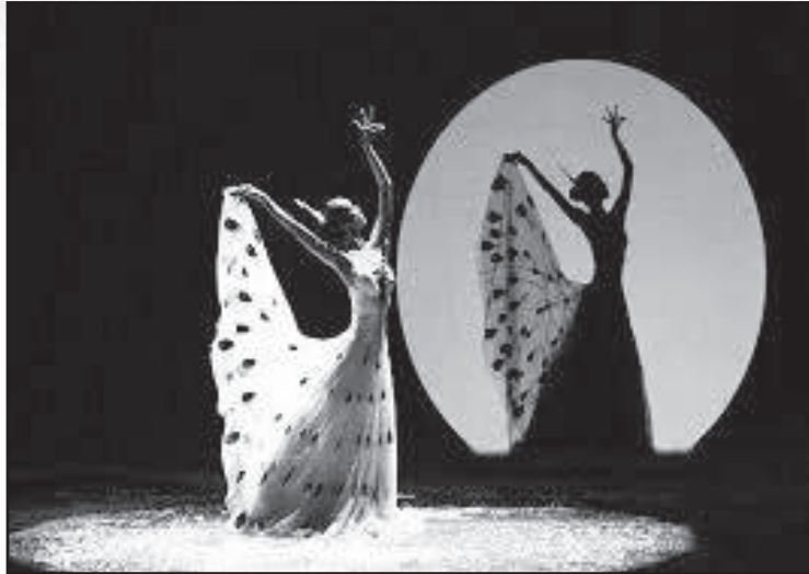
ภาพที่ 1

ภาพที่ 1 ศิลปะการรำราชของชาวไตที่มีชื่อเสียงเลื่องลืออย่าง“ระบำนกยูง” (孔雀舞Kǒngquè wǔ) ที่เลียนแบบท่าทางการเคลื่อนไหว รำแพขนกยูงก็สะท้อนวัฒนธรรมของชาวไตได้อย่างชัดเจนและงดงามเช่นกัน เนื่องจากในบริเวณสิบสองปันนา มีนกยูงเป็นจำนวนมาก ทั้งที่เป็นนกยูงป่าและนกยูงเลี้ยง ชาวไตนับถือนกยูงว่าเป็นนางพญาแห่งนรกและนับถือว่าเป็นสัตว์ศักดิ์สิทธิ์ประจำชนเผ่าจนกลายมาเป็นสัญลักษณ์ของชาวไตสิบสองปันนาอย่างหนึ่ง จนได้รับขนานนามว่า “ดินแดนแห่งนกยูง”