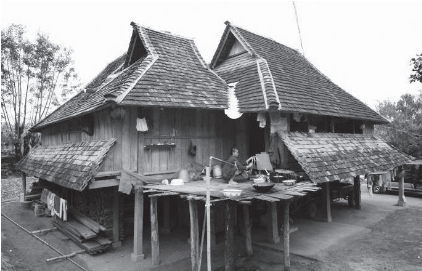
ภาพที่ 4

ด้านอาหารการกินของชาวไต ชาวไตที่ต่อหรงกินข้าวเจ้าเป็นอาหารหลัก ส่วนชาวไตที่สิบสองปีนาชอบกินข้าวเหนียว ชอบดื่มเหล้าและกินอาหารรสเผ็ด ชอบกินเนื้อ ปลา กุ้ง และชอบเคี้ยวหมาก