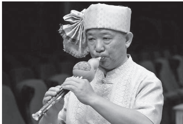
ภาพที่ 3 ขลุ่ยน้ำเต้า