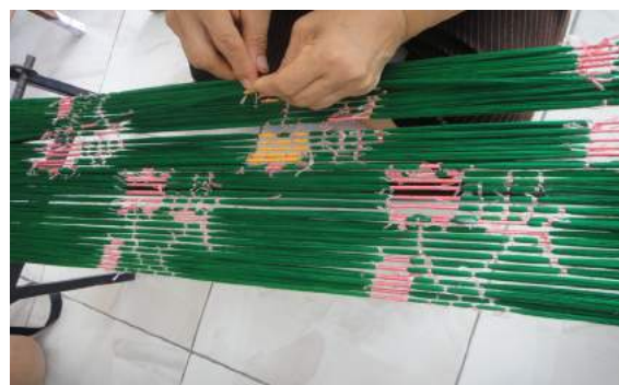
การโทมหมี่และการปลดหมี่

(February 27, 2015)