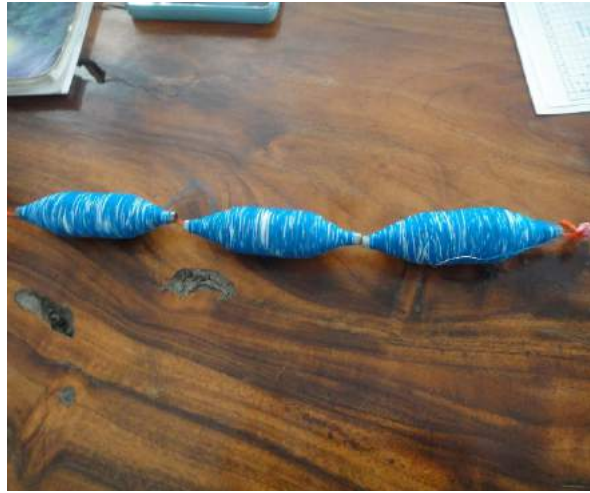
การกรอไหมเข้าหลอด