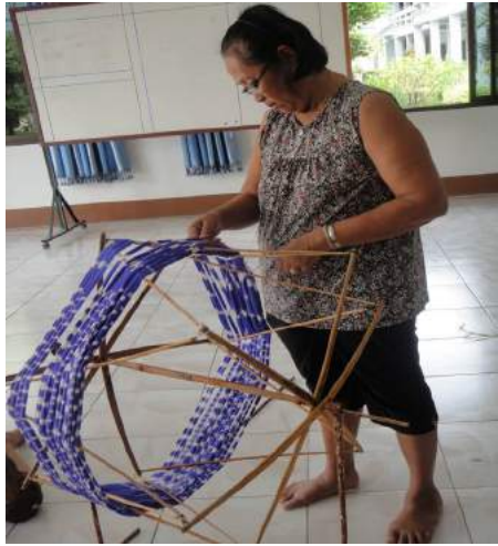
การนำไหมเข้ากรงและการคันไหม

Photo by Hussadin, Areewan. (February 27, 2015)