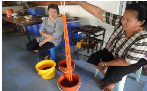
การย้อมหมี่

Photo by Hussadin, Areewan. (February 27, 2015)