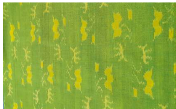
ตัวอย่างผ้าลายดอกสุพรรณนิการ์

Photo by Hussadin, Areewan. (February 27, 2015)