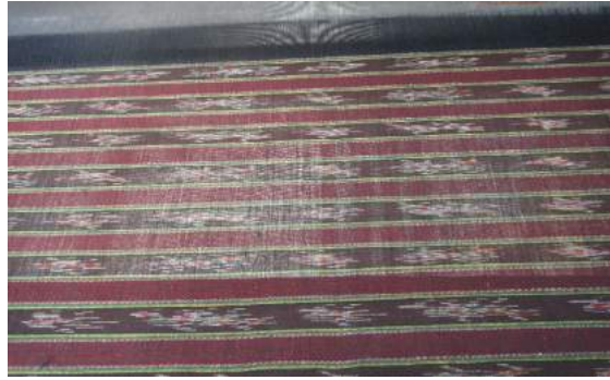
ตัวอย่างผ้าลายพญานาคน้อย

Photo by Hussadin, Arewan. (February 27, 2015)