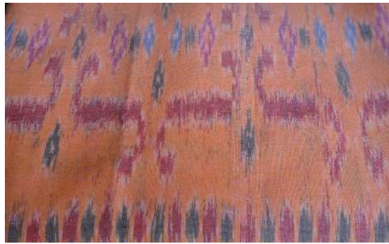
ตัวอย่างผ้าลายขอ

ขอ มาจากเรื่องเล่าของพญานาคที่ครั้งหนึ่งไม่สามารถบวชอยู่ได้ร่มศาสนาได้ จึงขอเป็นส่วนหนึ่งของศาสนา