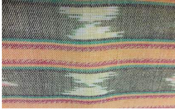
ตัวอย่างผ้าลายโพธิ์ศรี

โพธิ์ศรี เป็นส่วนหนึ่งของพิธีทอดกฐิน ในการทอดกฐินชาวพวนจะมีโพธิ์ศรี มีมัดหีบเงิน ซึ่งถือเป็นของศักดิ์สิทธิ์ในพิธีทางศาสนา