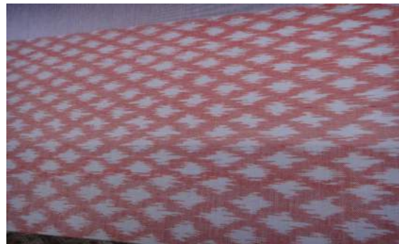
ตัวอย่างผ้าลายตุ้มตัน

Photo by Hussadin, Arewan. (February 27, 2015)