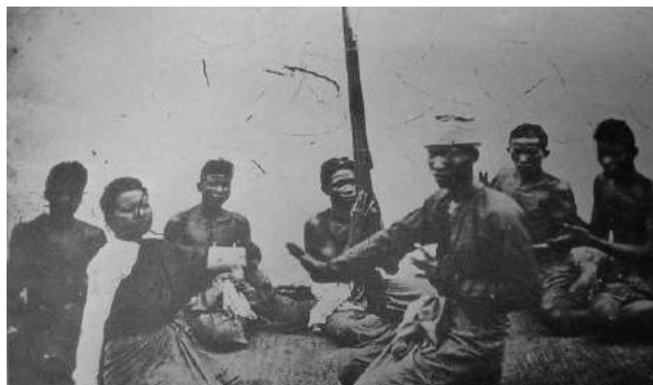
ภาพที่ 2 : หมอลำแสดงพิธีกรรม (หมอลำผีฟ้า)

2. หมอลำที่แสดงในพิธีกรรม ได้แก่ หมอลำผีฟ้า เป็นการลำที่มีจุดประสงค์ 2 ประการ คือ รักษาคนป่วยหรือพยากรณ์ดินฟ้าอากาศ ทำนองจะเป็นจังหวะสั้นบ้าง ยาวบ้าง ใช้แคนเป็นเครื่องดนตรีประกอบ เนื้อหากลอนลำจะเป็นการกล่าวถึงสิ่งศักดิ์สิทธิ์ที่หมอลำอัญเชิญมา โดยหมอลำมีคนเดียวและอาจมีบริวารเป็นผู้ฟ้อนรำประกอบลีลาการฟ้อน ไม่มีแบบแผนแน่นอน