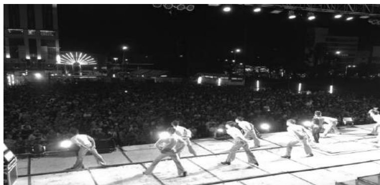
ภาพที่ 5 : กลุ่มแฟนคลับหมอลำเรื่องต่อกลอน

กล่าวคือ วัฒนธรรมเป็นสิ่งที่ทำหน้าที่เป็นตัวสื่อกลาง (Mediator) ในการพัฒนา “การดำรงอยู่” (Social Being) ของคนคนหนึ่งให้กลายเป็นมนุษย์ที่มี “จิตสำนึกทางสังคม” (Social Consciousness) ด้วยเหตุนี้ลักษณะวัฒนธรรมของแต่ละสังคมจึงขึ้นอยู่กับบริบทของสภาพความเป็นจริงของสังคมนั้น ดังนั้นหมอลำเรื่องต่อกลอนจึงเป็นสื่อหรือตัวกลางทำให้คนภาคอีสานรู้จักอนุรักษ์สื่อพื้นบ้านให้ดำรงอยู่ต่อไป เพราะเป็นอัตลักษณ์เด่นประเภทหนึ่งของภาคอีสาน