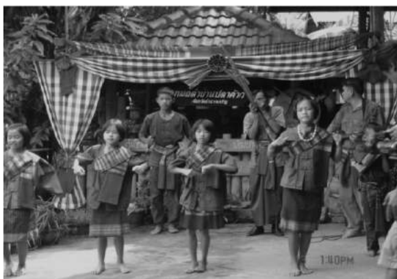
ภาพที่ 5 : กลุ่มเยาวชนบ้านปลาข้าว ที่มา : งานวิจัยศึกษาหมอลำปลาข้าว

Saynago, S. (2013) กล่าวว่า การเรียนรู้เป็นกระบวนการของการเปลี่ยนแปลงพฤติกรรมอันเนื่องมาจากประสบการณ์ที่แต่ละบุคคลได้รับมา ผลของการเรียนรู้จะช่วยให้เกิดการเปลี่ยนแปลงพฤติกรรมในด้านความรู้ทักษะและความรู้สึกกระบวนการเรียนรู้เป็นไปตามขั้นตอน ซึ่งจากกระบวนการเรียนรู้ทั้งหมดที่กล่าวมาข้างต้นประการหนึ่งเป็นข้อสำคัญมากในการเรียนรู้คือแรงจูงใจ หากการเรียนรู้ด้วยการบังคับผลลัพธ์คือความรู้ย่อมไม่เต็มที่หรืออาจจะได้ผลตามเกณฑ์ที่คาดหวัง แต่ความรู้นั้นไม่คงทนถาวร หลังจากการเรียนรู้สักพัก ความรู้นั้นก็จะเลือนหายไปไม่สามารถอธิบายได้ แรงจูงใจเป็นสิ่งที่สร้างขึ้นในมโนสำนึกที่ลักษณะไม่คงที่ และไม่สามารถประเมินได้โดยตรง เป็นจำนวนพลังงาน เป็นความพยายามที่บุคคลจะใช้เพื่อให้บรรลุเป้าหมายใดเป้าหมายนั้น ย่อมให้การเรียนรู้ประสบผลความสำเร็จ ซึ่งอาจเกิดขึ้นเพราะมีปัญหาความคาดหวังของแต่ละบุคคล ที่จะทำให้เกิดเป้าหมายหรือการเรียนรู้และการนำไปใช้ ดังนั้น เพื่อไม่ให้หมอลำหายไปจากภาคอีสาน จึงมีการส่งเสริมให้กับเยาวชนได้ฝึกฝนเรียนรู้ถึงวัฒนธรรมของตนเองโดยมีการจัดการเรียนการสอนวิชาหมอลำ เช่น หมอลำปลาข้าว จังหวัดอำนาจเจริญ เป็นต้น