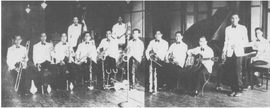
Figure 2 : Band of Public Relations Department in 1939