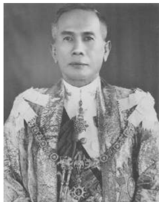
Figure 3 : Field Marshal Plaek Phibunsongkhram