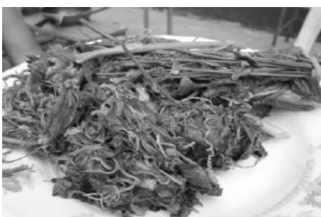
ภาพที่ 3 กลิ้งล่าหื้อซื่อโค