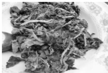
ภาพที่ 2 กะแห่นกะลา