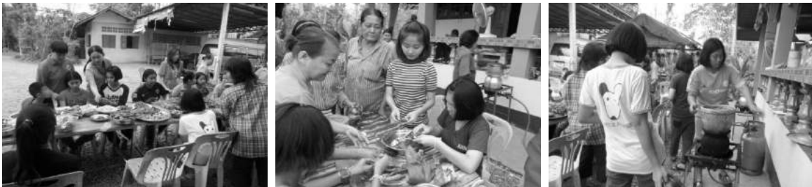
ภาพที่ 5 บรรยากาศการอบรมเชิงปฏิบัติการเกี่ยวกับอาหารพื้นเมืองแบบดั้งเดิมให้คนรุ่นใหม่

ซึ่งแนวทางที่ชุมชนเลือก คือ การเผยแพร่อาหารพื้นเมืองของชุมชนให้ประชาชนทั่วไปรับรู้ รวมถึงการจัดอบรมเชิงปฏิบัติการที่เป็นการอนุรักษ์และสืบสานความหลากหลายด้านอาหารพื้นเมืองของชุมชน โดยเฉพาะอาหารที่ถือว่าเป็นอัตลักษณ์ของชุมชนที่มีมาแต่ดั้งเดิมให้แก่เด็กและเยาวชนของชุมชน เพื่อให้อาหารเหล่านั้นยังคงอยู่ต่อไป