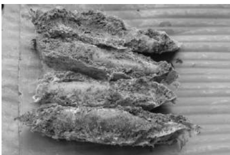
ภาพที่ 1 กำปูแปะ

อย่างไรก็ตามจากการเปลี่ยนแปลงทางสังคมทำให้วัฒนธรรมด้านอาหารของชาวอิมปีประสบกับปัญหาและอุปสรรคสำคัญ คือ การที่เด็กและเยาวชนคนรุ่นใหม่ในชุมชนไม่รู้จักรัก ไม่สามารถปรุง และส่งผลให้ไม่มีการสืบทอดความหลากหลายทางวัฒนธรรมทางด้านอาหารพื้นเมืองของชุมชน ซึ่งในปัจจุบันรายการอาหารที่ถือว่าเป็นเอกลักษณ์ของชุมชนอิมปีบ้านดงที่ยังคงรับประทานกันอยู่ในวงจำกัด เฉพาะประชาชนวัยกลางคนก่อนไปทางผู้สูงอายุ มีจำนวน 4 รายการ ดังภาพที่ 1-4 โดยแต่ละชนิดมีวัตถุดิบที่หาได้ง่ายตามฤดูกาล และกระบวนการที่ไม่ซับซ้อน ดังตารางที่ 1