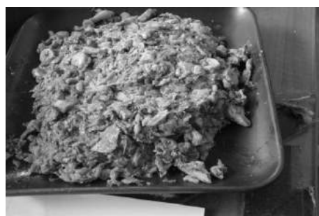
ภาพที่ 4 พะสะ