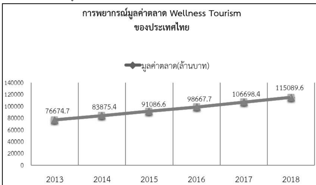
ภาพที่ 5 : การพยากรณ์มูลค่าตลาด Wellness Tourism ของประเทศไทย

ที่มา : Department of Trade Negotiations (2014)