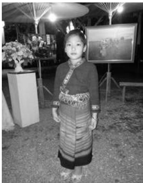
ความน่ารักของเด็กสาวใส่ชุดชาติพันธุ์ไทลื้อ

ปัจจัยด้านนโยบายของกระทรวงศึกษาธิการ ที่ส่งเสริมให้เด็กนักเรียนแต่งกายด้วยชุดประจำชาติพันธุ์ประจำท้องถิ่น เป็นอีกปัจจัยหนึ่งที่มีส่วนทำให้มีการดำรงอยู่ของการทอผ้าถึงแม้ว่าจะไม่มากนัก แต่ก็ยังส่งผลต่อการนิยมแต่งกายด้วยชุดประจำชาติพันธุ์แต่ละพื้นที่รวมทั้งชาวไทลื้อด้วย