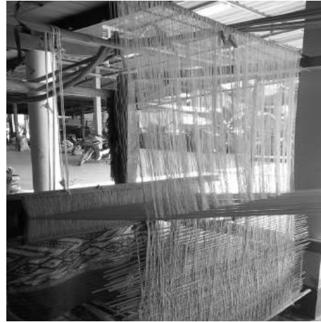
ผ้าซิ่นลายน้ำไหลในกีกระตุก: เครื่องมือที่ทำให้ภูมิปัญญาการทอผ้ายังคงอยู่คู่สังคม

ในอดีตผ้าทอไทลื้อผลิตจากฝ้ายซึ่งชาวไทลื้อปลูกเอง กรอเอง ปั่น และย้อมเอง เป็นวัสดุจากธรรมชาติทั้งหมด แต่ปัจจุบันผู้ทอผ้ามีการปรับตัวให้เข้ากับความต้องการของตลาดและเพื่อให้เข้ากับวิถีการดำเนินชีวิตของไทลื้อด้วย โดยมีการสั่งซื้อฝ้ายดิบแล้วนำมาย้อมสีเอง และบางส่วนใช้ด้ายประดิษฐ์ ซึ่งเป็นวัสดุสังเคราะห์เพราะหาง่าย สะดวก และผู้บริโภคมีความต้องการเพราะสวมใส่สบาย แต่ยังคงเอกลักษณ์ดั้งเดิมของลวดลายการทอผ้าไว้ (San Pu Loei Community, n.d.)