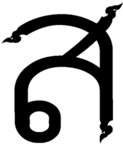
ภาพที่ 7 ผลงานการออกแบบชุดตัวอักษร มหาวิทยาลัยสยาม ภาษาไทย(ตัวหนา)

๐ ๑ ๒ ๓ ๔ ๕ ๖ ๗ ๘ ๙ ๐ ๑ ๒ ๓ ๔ ๕ ๖ ๗ ๘ ๙ ๐ ๑ ๒ ๓ ๔ ๕ ๖ ๗ ๘ ๙ ๐ ๑ ๒ ๓ ๔ ๕ ๖ ๗ ๘ ๙ โ ไ ใ ๑ ๒ ๓ ๔ ๕ ๖ ๗ ๘ ๙