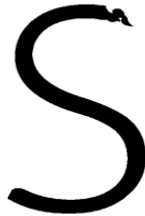
ภาพที่ 4 ผลงานการออกแบบชุดตัวอักษร มหาวิทยาลัยสยาม ภาษาอังกฤษ(ปกติ)

A B C D E F G H I J K L M N O P Q R S T U V W X Y Z a b c d e f g h i j k l m n o p q r s t u v w x y z