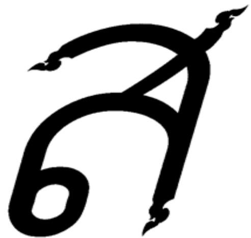
ภาพที่ 11 ผลงานการออกแบบชุดตัวอักษร มหาวิทยาลัยสยาม ภาษาอังกฤษ(ตัวหนา)