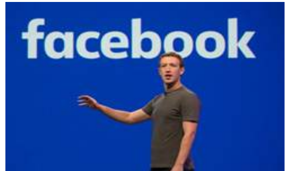
ภาพที่ 2 มาร์ค ซัคเคอร์เบิร์ก ผู้ก่อตั้งเฟซบุ๊ก

สนทนาของตนได้มีประสบการณ์ร่วมกัน จุดเด่นของ Social Network อยู่ที่การแสดงความคิดเห็นต่อประสบการณ์ได้ทันที และกลุ่มสนทนาสามารถโต้ตอบในประเด็นเดียวกันได้ทั้งหมดทุกคน ซึ่ง Social Network ในยุคแรก ๆ อย่าง Hi5 นั้นได้รับความนิยมอย่างมากในประเทศไทย จนมีผู้ใช้มากถึง 2 ล้านคน ในปีพ.ศ. 2551 ซึ่งจัดว่าสูงมากในขณะนั้นซึ่งมีจำนวนผู้ใช้อินเทอร์เน็ตในไทยเพียงไม่กี่ล้านคนเท่านั้น