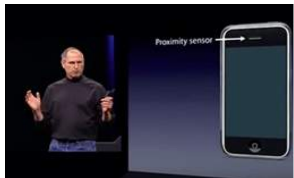
ภาพที่ 1 สตีฟ จ๊อบส์ กับการเปิดตัว iPhone เป็นครั้งแรก

นอกจากนี้ iPhone ยังมีระบบปฏิบัติการในเครื่อง (Operation System) ที่เรียกว่า iOS ซึ่งเปรียบได้กับระบบ Windows ที่เราใช้ในคอมพิวเตอร์ ซึ่งการที่มีระบบปฏิบัติการแบบนี้ ทำให้โทรศัพท์เครื่องเล็ก ๆ สามารถทำงานได้ทัดเทียมกับคอมพิวเตอร์ขนาดใหญ่ ทำงานที่ซับซ้อนพร้อม ๆ กันในครั้งเดียว (Multi-tasking) และมีลักษณะการทำงานแบบตลอดเวลาโดยไม่ต้องปิดเครื่อง (Always On) แม้ iPhone จะไม่ใช่โทรศัพท์แบบแรกที่มีระบบปฏิบัติการในเครื่อง แต่ระบบ iOS ได้สร้างความประทับใจให้กับผู้ใช้ในขณะนั้นได้เป็นอย่างดี