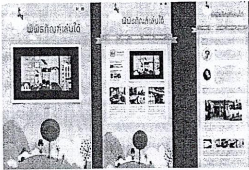
รูปที่ 3.1 แสดงหน้าจอหลักของเว็บไซต์ (ซ้าย) รูปที่ 3.2 แสดงหน้า Home ของเว็บไซต์ (กลาง) รูปที่ 3.3 แสดงหน้าเกี่ยวกับของเว็บไซต์ (ขวา)

สื่อการนำเสนอ พร้อมวิเคราะห์และประเมินผลการวิเคราะห์ข้อมูลดังแสดงรูปที่ 3.1-3.7