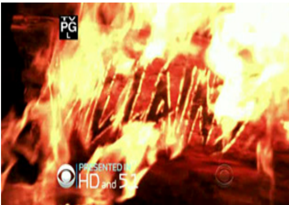
ภาพ 4.3 ฉากเปิดของรายการ Survivor (Probst, 2010)