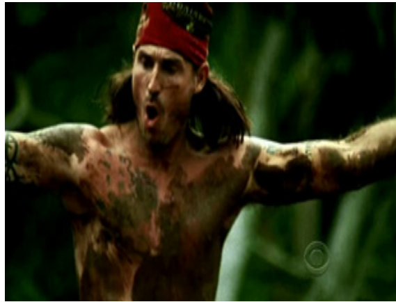
ภาพ 4.5 ฉากเปิดของรายการ Survivor (Probst, 2010)