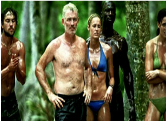
ภาพ 4.8 ฉากเปิดของรายการ Survivor (Probst, 2010)