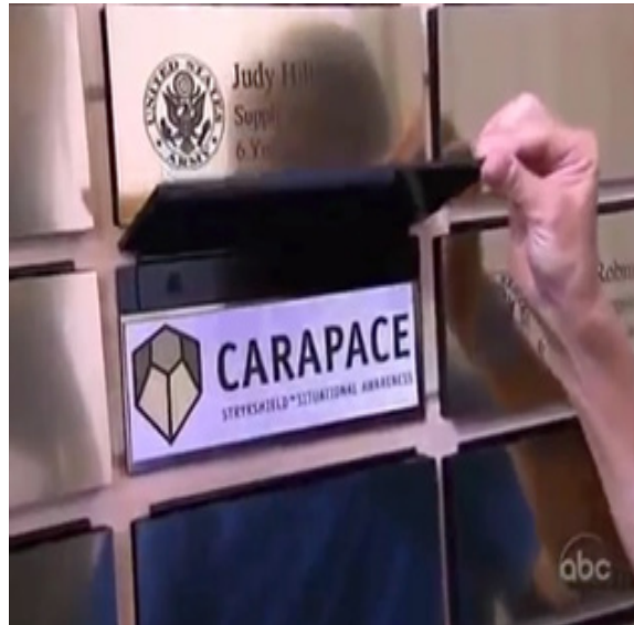
ภาพ 7.3 การตัดต่อแสดงถึงการรวบรัดเวลาในรายการ Extreme Makeover Home Edition (Penning, 2011)