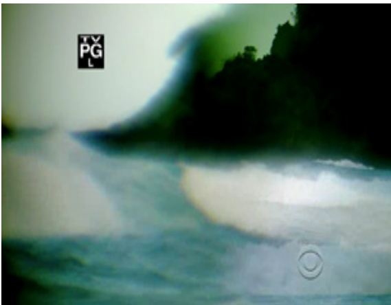
ภาพ 4.2 ฉากเปิดของรายการ Survivor (Probst, 2010)