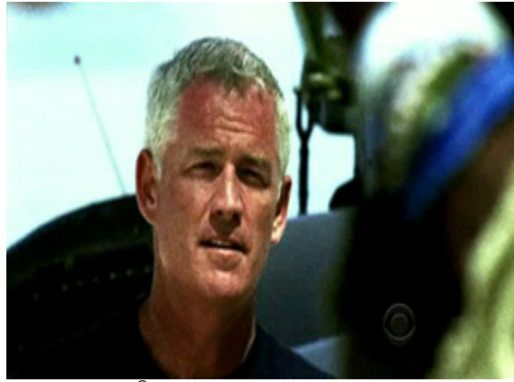
ภาพ 4.4 ฉากเปิดของรายการ Survivor (Probst, 2010)