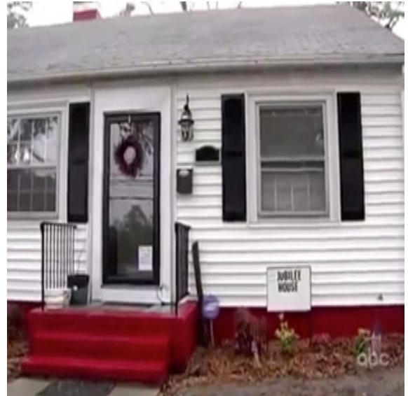
ภาพ 5.2 ฉากแนะนำผู้เข้าร่วมรายการในรายการ Extreme Makeover home Edition (Penning, 2011)