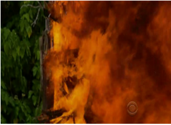
ภาพ 6.10 การตัดต่อแสดงถึงการรวบรัดเวลาในรายการ Survivo (Probst, 2010)

ตัวอย่างลักษณะการตัดต่อเพื่อรวบรัดของรายการ “Survivor” จากภาพ 6.1-6.10 เป็นสถานการณ์ที่ผู้เข้าแข่งขันที่ยังอยู่ในการแข่งขันมาริมชายหาดเพื่อระลึกถึงผู้เข้าแข่งขันที่ออกจากการแข่งขันไปแล้ว ฉากนี้มีลักษณะการตัดต่อแบบสลับระหว่างช็อตที่แขวนอยู่และผู้เข้าแข่งขันที่มองช็อตอยู่ ผู้เข้าแข่งขันต้องทำการเผาป้ายชื่อ ซึ่งมีการตัดต่อแบบรวบรัดเพื่อไม่ให้ใช้เวลากับการเผาไม้มากเกินไป จึงต้องตัดภาพที่ไฟกำลังไหม้อยู่หลายมุมเพื่อย่นเวลาให้น้อยลง แต่ผู้ชมยังเข้าใจได้ว่า มีกระบวนการเผาเกิดขึ้น