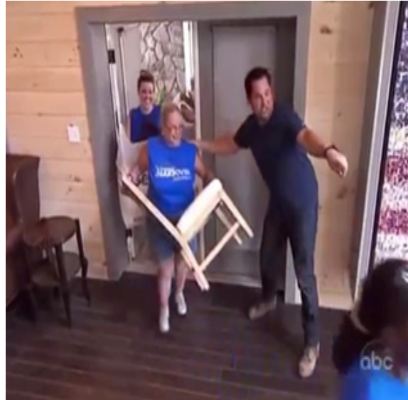
ภาพ 7.2 การตัดต่อแสดงถึงการรวบรัดเวลาในรายการ Extreme Makeover Home Edition (Penning, 2011)