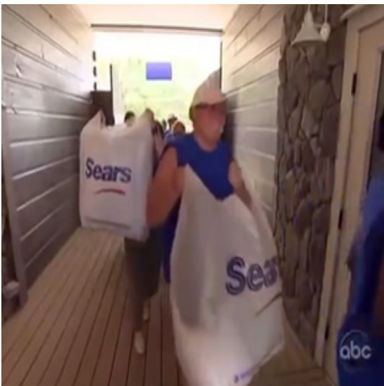
ภาพ 7.1 การตัดต่อแสดงถึงการรวบรัดเวลาในรายการ Extreme Makeover Home Edition (Penning, 2011)

ตัวอย่างลักษณะการตัดต่อเพื่อรวบรัดของรายการ “Survivor” จากภาพ 6.1-6.10 เป็นสถานการณ์ที่ผู้เข้าแข่งขันที่ยังอยู่ในการแข่งขันมาริมชายหาดเพื่อระลึกถึงผู้เข้าแข่งขันที่ออกจากการแข่งขันไปแล้ว ฉากนี้มีลักษณะการตัดต่อแบบสลับระหว่างช็อตที่แขวนอยู่และผู้เข้าแข่งขันที่มองช็อตอยู่ ผู้เข้าแข่งขันต้องทำการเผาป้ายชื่อ ซึ่งมีการตัดต่อแบบรวบรัดเพื่อไม่ให้ใช้เวลากับการเผาไม้มากเกินไป จึงต้องตัดภาพที่ไฟกำลังไหม้อยู่หลายมุมเพื่อย่นเวลาให้น้อยลง แต่ผู้ชมยังเข้าใจได้ว่า มีกระบวนการเผาเกิดขึ้น