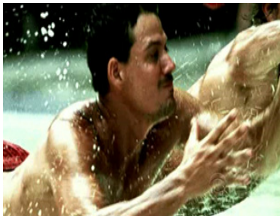
ภาพ 4.6 ฉากเปิดของรายการ Survivor (Probst, 2010)