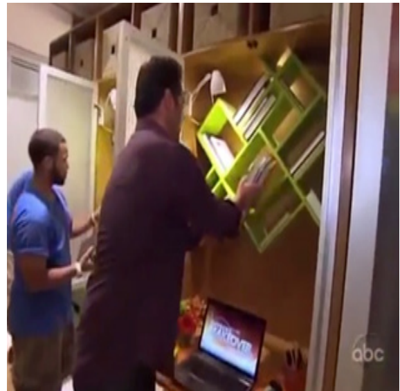
ภาพ 7.6 การติดต่อแสดงถึงการรวบรัดเวลาในรายการ Extreme Makeover Home Edition (Penning, 2011)