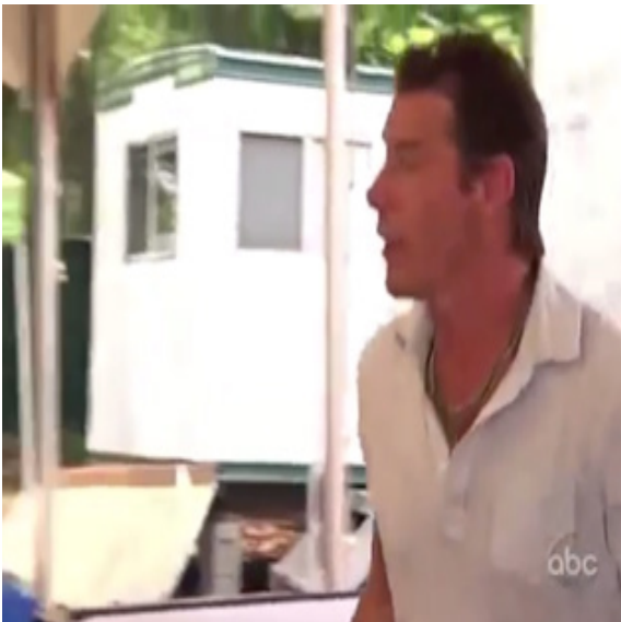
ภาพ 7.9 การตัดต่อแสดงถึงการรวบรัดเวลาในรายการ Extreme Makeover Home Edition (Penning, 2011)

(3) การกำกับความหมายของรายการโทรทัศน์ด้วยตัวหนังสือพร้อมกับภาพ (Anchorage) ตัวหนังสือมีความสำคัญต่อรายการโทรทัศน์มาก เพราะรายการโทรทัศน์จะมีตัวละครหลายตัว ถ่ายทำในหลายๆสถานที่ และเพื่อไม่ให้ผู้ชมสับสน จึงจำเป็นต้องมีตัวหนังสือกำกับว่าตัวละครนี้หรือผู้เข้าแข่งขันคนนี้เป็นใครและจำเป็นต้องมีทุกครั้ง ที่มีการพูดถึงตัวละครนั้นๆ จะเป็นสิ่งที่ขาดไม่ได้โดยเด็ด