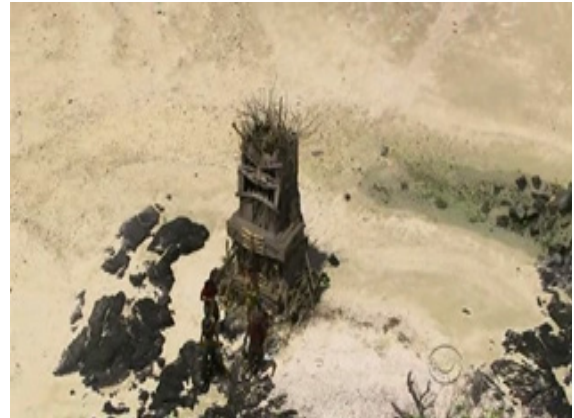
ภาพ 6.7 การตัดต่อแสดงถึงการรวบรัดเวลาในรายการ Survivor (Probst, 2010)