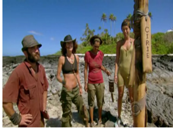
ภาพ 6.1 การตัดต่อแสดงถึงการรวบรัดเวลาในรายการ Survivor (Probst, 2010)

แนะนำมูลนิธิบ้านจูบิลีโดยการตัดต่อผสมภาพที่เกี่ยวกับมูลนิธิ ไม่ว่าจะ เป็นภาพภายนอกบ้าน ให้เห็นว่าตัวบ้านเป็นอย่างไร แล้วต่อด้วยภาพภายในบ้านว่ามีใครอยู่บ้าง ทำงานกันอย่างไร และอยู่กันอย่างไร ในระหว่างการตัดต่อ มีบารบารา (Babara) เจ้าของบ้านเป็นคนเล่าเรื่องถึงความลำบากอยู่ด้วย