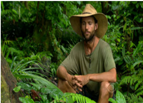
ภาพ 2.1 ฉากสัมภาษณ์ความรู้สึกของผู้เข้าแข่งขันในรายการ Survivor (Probst, 2010)

จากภาพ 2.1 และ 2.2 ฉากเหล่านี้ในรายการ Survivor แสดงให้เห็นว่าผู้ชมได้รับรู้ว่าผู้เข้าแข่งขันแต่ละคนรู้สึกอย่างไรกับผู้เข้าแข่งขันคนอื่นหรือรู้สึกอย่างไรกับสถานการณ์นั้นๆ ซึ่งฉากเหล่านี้เป็นฉากที่นอกเหนือจากเรื่องราวหลักที่กำลังดำเนินอยู่เพราะฉะนั้นจำเป็นต้องใช้การตัดต่อเพื่อหาจังหวะในการสอดแทรกเข้าไปในเรื่องหลัก