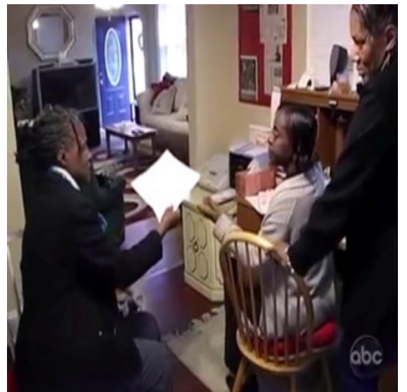
ภาพ 5.3 ฉากแนะนำผู้เข้าร่วมรายการในรายการ Extreme Makeover home Edition (Penning, 2011)