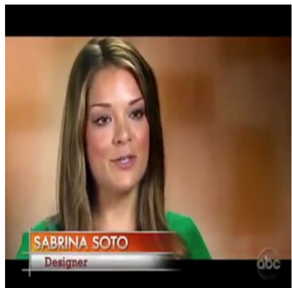
ภาพ 1.2 ตัวอย่างสัดส่วนของ Panofsky จากรายการ Extreme Makeover Home Edition (Probst, 2010)

สมควรและต้องมีความจำเป็นจริงๆ ที่จะต้องใช้ศาสตร์การตัดต่อเพื่อมาช่วยในการตกแต่งเนื้อหาให้เป็นเรื่องราวที่น่าติดตาม