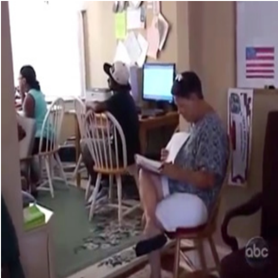
ภาพ 5.5 ฉากแนะนำผู้เข้าร่วมรายการในรายการ Extreme Makeover home Edition (Penning, 2011)