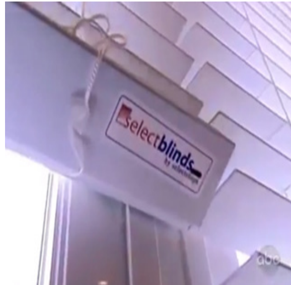
ภาพ 7.7 การติดต่อแสดงถึงการรวบรัดเวลาในรายการ Extreme Makeover Home Edition (Penning, 2011)

ตัวอย่างลักษณะการติดต่อเพื่อรวบรัดของรายการ “Extreme Makeover Home Edition” จากภาพ 7.1-7.9 เป็นฉากหลังจากบ้านสร้างเรียบร้อยแล้ว เป็นการจัดวางเฟอร์นิเจอร์ และตกแต่งบ้าน ลักษณะการติดต่อเป็นการเลือกใช้เฉพาะภาพแอคชั่น(Action Shot) แล้วนำมาผสมกัน ทำให้เห็นว่าทุกคนกำลังตกแต่งห้องในแต่ละห้องในเวลาเดียวกันและระยะเวลาของแต่ละภาพที่ใช้ เฉลี่ยภาพละ 2.6 วินาที ซึ่งเป็นระยะเวลาที่ไม่มากนักในแต่ละภาพ ช่วยให้รวบรัดเวลาลง แต่ผู้ชมยังเข้าใจว่าเกิดอะไรขึ้นในฉากนี้