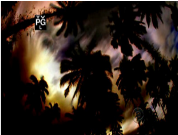
ภาพ 4.1 ฉากเปิดของรายการ Survivor (Probst, 2010)