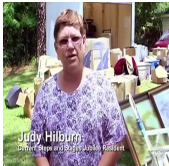
ภาพ 3.2 ฉากสัมภาษณ์ความรู้สึกของผู้ร่วมรายการ Extreme Makeover Home Edition (Penning, 2011)

ฉากเหล่านี้มีความจำเป็นต่อรายการโทรทัศน์มากเพราะทำให้ผู้ชมรู้สึกมีส่วนร่วมกับการรายการจึงเป็นเหตุผลทำให้รายการเหล่านี้เป็นที่นิยมมา