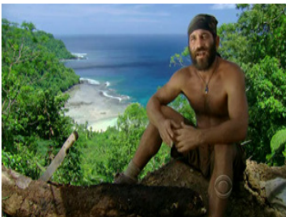
ภาพ 2.2 ฉากสัมภาษณ์ความรู้สึกของผู้เข้าแข่งขันในรายการ Survivor (Probst, 2010)