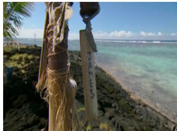
ภาพ 6.2 การตัดต่อแสดงถึงการรวบรัดเวลาในรายการ Survivor (Probst, 2010)