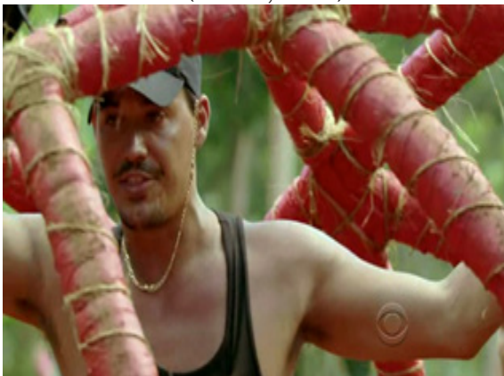
ภาพ 6.5 การตัดต่อแสดงถึงการรวบรัดเวลาในรายการ Survivor (Probst, 2010)