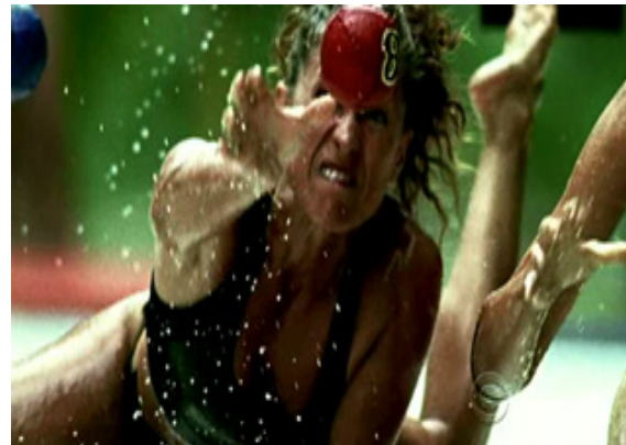
ภาพ 4.7 ฉากเปิดของรายการ Survivor (Probst, 2010)