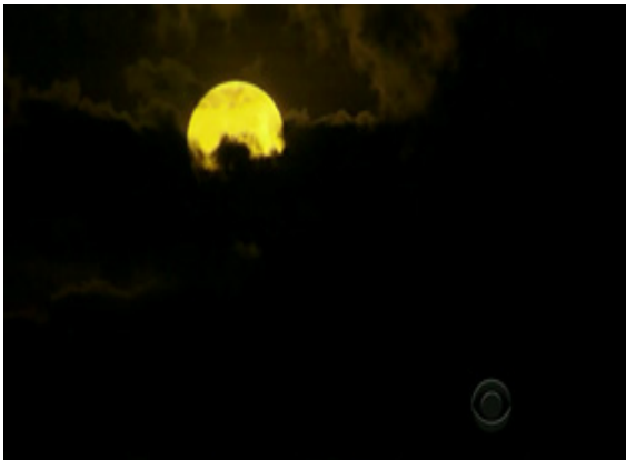
ภาพ 4.9 ฉากเปิดของรายการ Survivor (Probst, 2010)

ตามภาพ 4.1-4.9 เป็นลักษณะการตัดแบบผสมแบบแนะนำของรายการ Survivor โดยให้เวลาในแต่ละภาพเฉลี่ย 3.4 วินาที และแต่ละภาพมีความต่อเนื่องกันในเชิงความคิด โดยมีการผสมภาพของสถานที่ถ่ายทำซึ่งจะเป็นริมชายหาด ต่อด้วยผู้เข้าแข่งขันแต่ละคน มีทั้งภาพบุคคล (Portrait Shot) และภาพที่ผู้เข้าแข่งขันกำลังเล่นเกมในตอนที่ผ่านมา (Action Shot) แล้วจึงเริ่มต้นรายการ