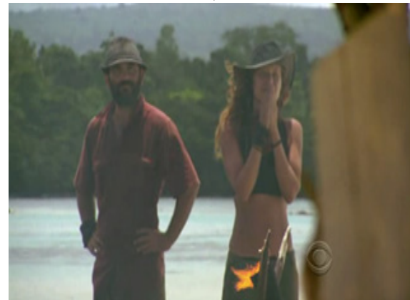
ภาพ 6.9 การตัดต่อแสดงถึงการรวบรัดเวลาในรายการ Survivor (Probst, 2010)