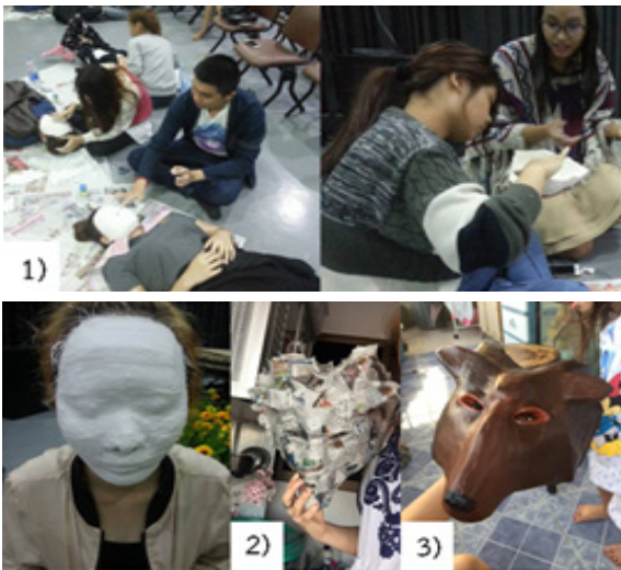
ภาพที่ 3 วิธีการทำหน้ากาก

2.4 การทำปีกนก มีขั้นตอนการทำ ดังนี้ (1) วาดและตัดผ้าสักหลาด เป็นรูปครึ่งวงกลม ความกว้างและยาววัดจากตัวนักแสดง (2) ตัดผ้าสักหลาดประมาณ 3 สีเพื่อจะนำมาเป็นขนนกและเพิ่มลวดลาย (3) นำผ้าที่ตัดเป็นขนนกมาวางเรียงและเย็บให้ติดกัน (ดูระยะให้สวยงาม ไม่วางห่างกันจนเกินไป) โดยขนนกจะต้องติดทั้งสองด้าน และ (4) ตัดผ้าให้เป็นแถบเล็กเพื่อนำมาผูกติดกับช่วงแขนของนักแสดง