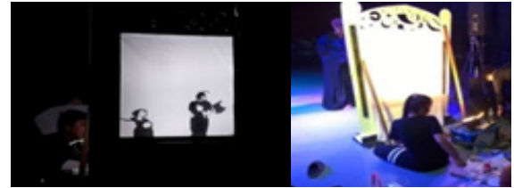
ภาพที่ 2 วิธีการทำหุ่นเงา และวิธีการเล่นหุ่นเงา

2.3 กระบวนการผลิตหน้ากาก และ ปีก หน้ากากและปีกจะเสริมนักแสดงในบทบาทของสัตว์ (หมี ฝูเสื่อ กวาง และนก) และเสริมการเคลื่อนไหวของนักเต้นด้วยปีก เพื่อเพิ่มความน่าสนใจให้กับละคร