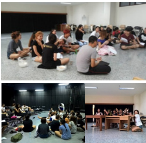
ภาพที่ 5 ภาพการซ้อมการแสดงละครหุ่นร่วมสมัย

• การซ้อมท่องจำบทละครและลงรายละเอียดของตัวละคร การซ้อมเพื่อท่องจำบทและจังหวะของบทสนทนาและบทบรรยาย (line) ของตัวเอง เพื่อทำความเข้าใจทั้งความหมาย และอารมณ์ของตัวละคร นอกจากนี้มีการซ้อมเพื่อพัฒนาการของตัวละคร มองหาจุดประสงค์ของตัวละครว่าร้องเพลง เพราะมีความต้องการอย่างไร