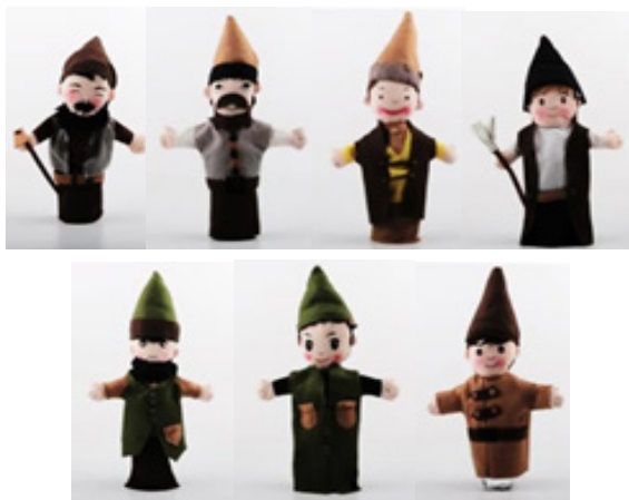
ภาพที่ 1 วิธีการทำหุ่นมือ และภาพหุ่นสำเร็จ

2.2 กระบวนการผลิตหุ่นเงา หุ่นเงา ถูกนำมาใช้เล่าเรื่องในระจกมีวิธีการทำ ดังนี้ 1) วาดตัวละคร หรือต้นไม้ลงบนกระดาษแข็ง ตัดออกตามรอยดินสอที่วาด 2) นำตัวละครมาติดกับไม้ที่ใช้สำหรับเชิด ด้วยกาวและเทปกาว อาจจะใช้ไม้ตามไว้ หากตัวหุ่นไม่สามารถตั้งตรง 3) หากอยากเพิ่มสีสันที่สดใส ให้เจาะรูแล้วติดกระดาษแก้วด้วยกาวลงตาม ที่เจาะรู เพื่อตกแต่งให้ตัวหุ่นมีสีสันที่สวยงาม