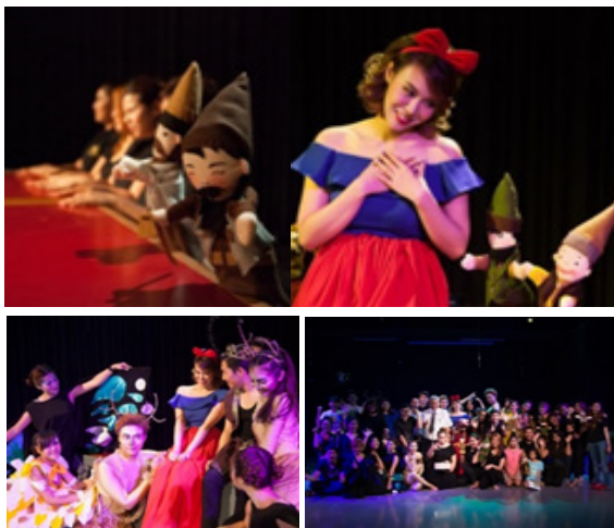
ภาพที่ 6 การแสดงละครหุ่นร่วมสมัย

3.7 กระบวนการจัดแสดงละครโดยนักศึกษาได้เรียนรู้หลักการประชาสัมพันธ์ละคร และแสดงที่โรงละครมหาวิทยาลัยสยาม ในวันที่ 13 พฤษภาคม พ.ศ.2559 จากนั้นมีการประเมินผลโดยการประชุมพูดคุยกันของนักแสดง ทีมงานของนักศึกษา โดยมีอาจารย์/ครูผู้ดูแลคอยกำกับและให้คำแนะนำในการทำงานต่อไป