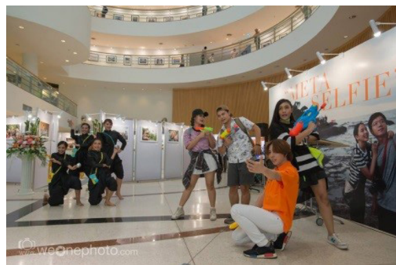
ภาพแสดงการเคลื่อนไหวและการแบ่งกลุ่มนักแสดงออกเป็น 2 กลุ่ม

กลุ่มที่ 2 หม่อมวลความเป็นไทย จำนวนนักแสดงหญิงทั้งหมด 4 คน เชื่อมระหว่างความเป็นไทยและความเป็นสากล โดยกำหนดกระบวนการท่าที่คล้ายกัน แต่แตกต่างกันในรายละเอียด เช่น การวางมือ มีการใช้รูปแบบการใช้มือแบบนาฏศิลป์ไทย (จีบ, ตั้งวง) และแบ่งหน้าที่ในการดำเนินเรื่องเป็นในฐานะเจ้าของประเทศไทย หรือ ตัวแทนของความเป็นไทย