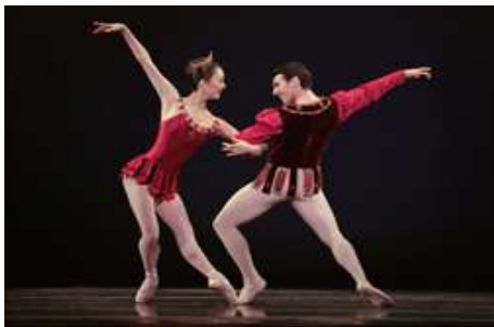
ภาพที่ 2 รูปการแสดงบัลเลต์

ความงามตามแบบฉบับ จารีต เพื่อให้ผู้ชมเกิดอารมณ์ความรู้สึกร่วมไปกับผลงานนาฏศิลป์ เพราะฉะนั้นความงามจึงเกิดขึ้นผ่านงานทางนาฏศิลป์ที่อาศัยองค์ประกอบที่ค่อนข้างครบในศาสตร์ของงานทางด้านศิลปะแต่ละแขนงมารวมกันไว้ที่มีความวิจิตรตระการตา เช่น งานนาฏศิลป์ไทย หรือ บัลเลต์ (นาฏศิลป์ตะวันตก) เองก็ตาม