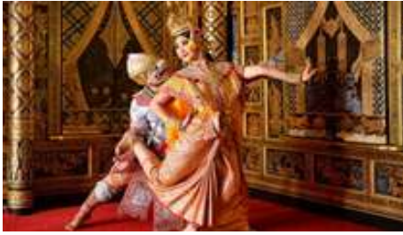
ภาพที่ 1 รูปการแสดงนาฏศิลป์ไทยชุด หนุมานจับนางเบญจกาย