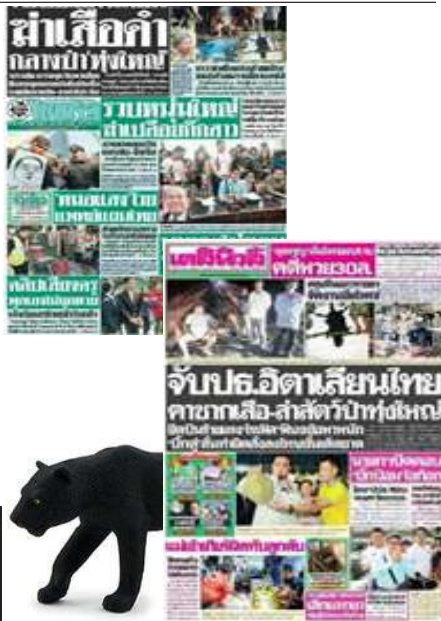
ภาพที่ 5 ข่าวน่าหนึ่งในคดีฆ่าเสือดำ