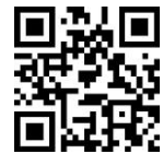
QR Code ของสำนักฯ

เมื่อวันอาทิตย์ที่ 12 กุมภาพันธ์ พุทธศักราช 2560 สมเด็จพระเจ้าอยู่หัวมหาวชิราลงกรณ บดินทรเทพยวรางกูร ได้ทรงพระกรุณาโปรดเกล้าฯ ประกอบการพระราชพิธีสถาปนา สมเด็จพระมหามุนีวงศ์ วัดราชบพิธสถิตมหาสีมาราม ขึ้นเป็นสมเด็จพระสังฆราชพระองค์ที่ 20 แห่งกรุงรัตนโกสินทร์ ณ พระอุโบสถวัดพระศรีรัตนศาสดาราม ในพระบรมมหาราชวัง โดยมีกรรมการมหาเถรสมาคม เจ้าคณะใหญ่ เจ้าคณะภาค และเจ้าคณะจังหวัดต่างๆ เข้าร่วมพิธีในครั้งนี้ด้วย พระนามของสมเด็จพระอริยวงศาคตญาณ สมเด็จพระสังฆราช สกลมหาสังฆปริณายก (อัมพร อมพโร) ที่ได้จารึกในพระสุพรรณบัฏมีดังนี้ “สมเด็จพระอริยวงศาคตญาณ สุขุมธรรมวิธานธำรง สกลมหาสังฆปริณายก ตรีปิฎกธราจารย์ อัมพรภาสิธานสังฆวิสุต ปาพจนุตตมสาสนโสภณ กิตตินิรมลคฤฐานีบัณฑิต วชิราลงกรณนริศรปลันนาภิสิตประกาศ วิสารทนาถธรรมทูตาทิภูม ทศมินทรสมมุติปฐมสกลคณาธิเบศร ปวิธเนตโยภาสวาสนวงศวิวัฒน์ พุทธบริษัทคารวสถาน วิบูลลีลลสมาจารวัตรวิปัสสนสุนทร ชินวรมหามุนีวงศานุศิษฏ บวรธรรมบพิตร สมเด็จพระสังฆราช”