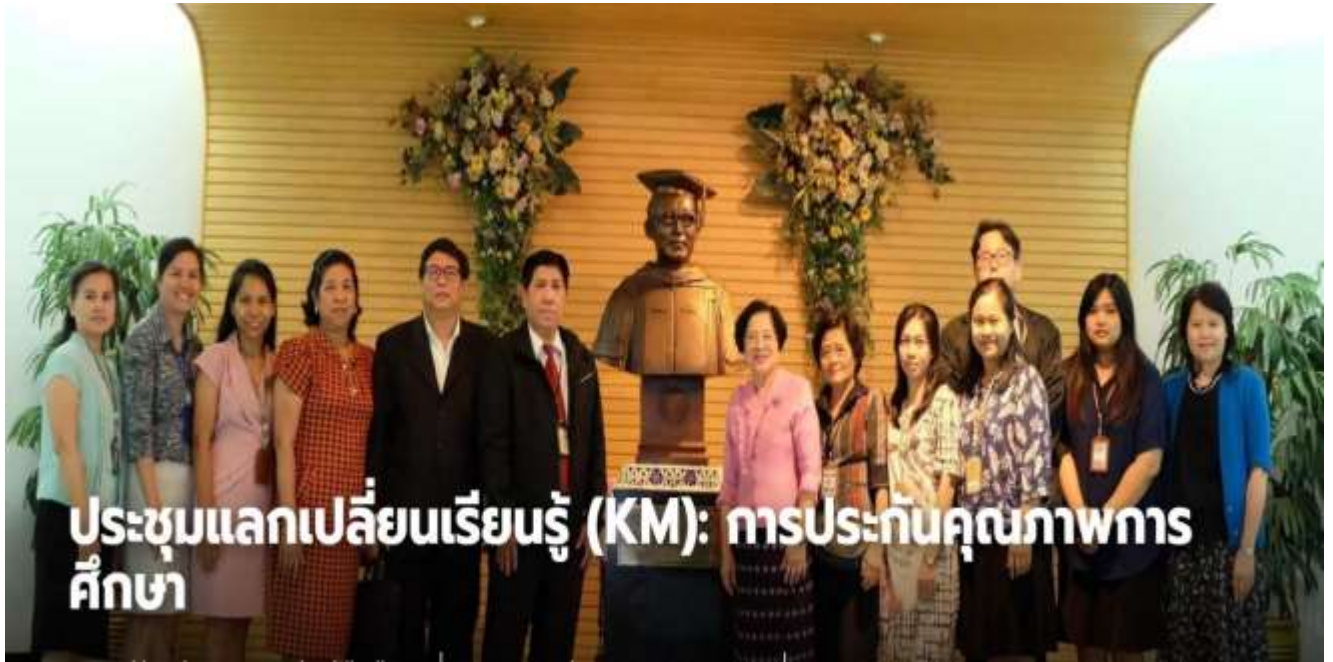
องค์ความรู้เกี่ยวกับประกันคุณภาพการศึกษา