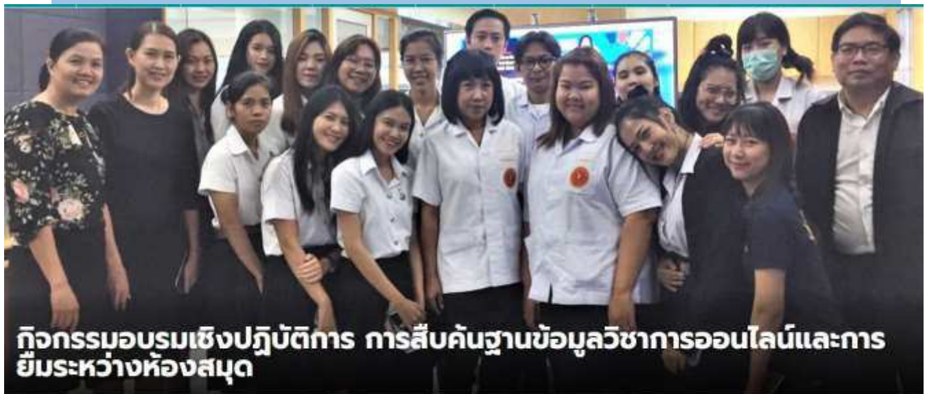
กิจกรรมอบรมเชิงปฏิบัติการ การสืบค้นฐานข้อมูลวิชาการออนไลน์และการยืมระหว่างห้องสมุด