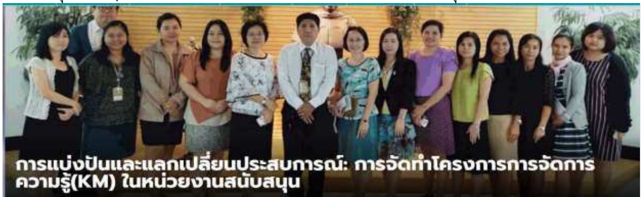
การแบ่งปันและแลกเปลี่ยนประสบการณ์: การจัดทำโครงการการจัดการความรู้(KM) ในหน่วยงานสนับสนุน

จัดขึ้นเมื่อวันพุธที่ 27 พฤศจิกายน 2562 เวลา 14.00-16.00 น. ณ อาคาร 12 สำนักหอสมุดและทรัพยากรสารสนเทศ