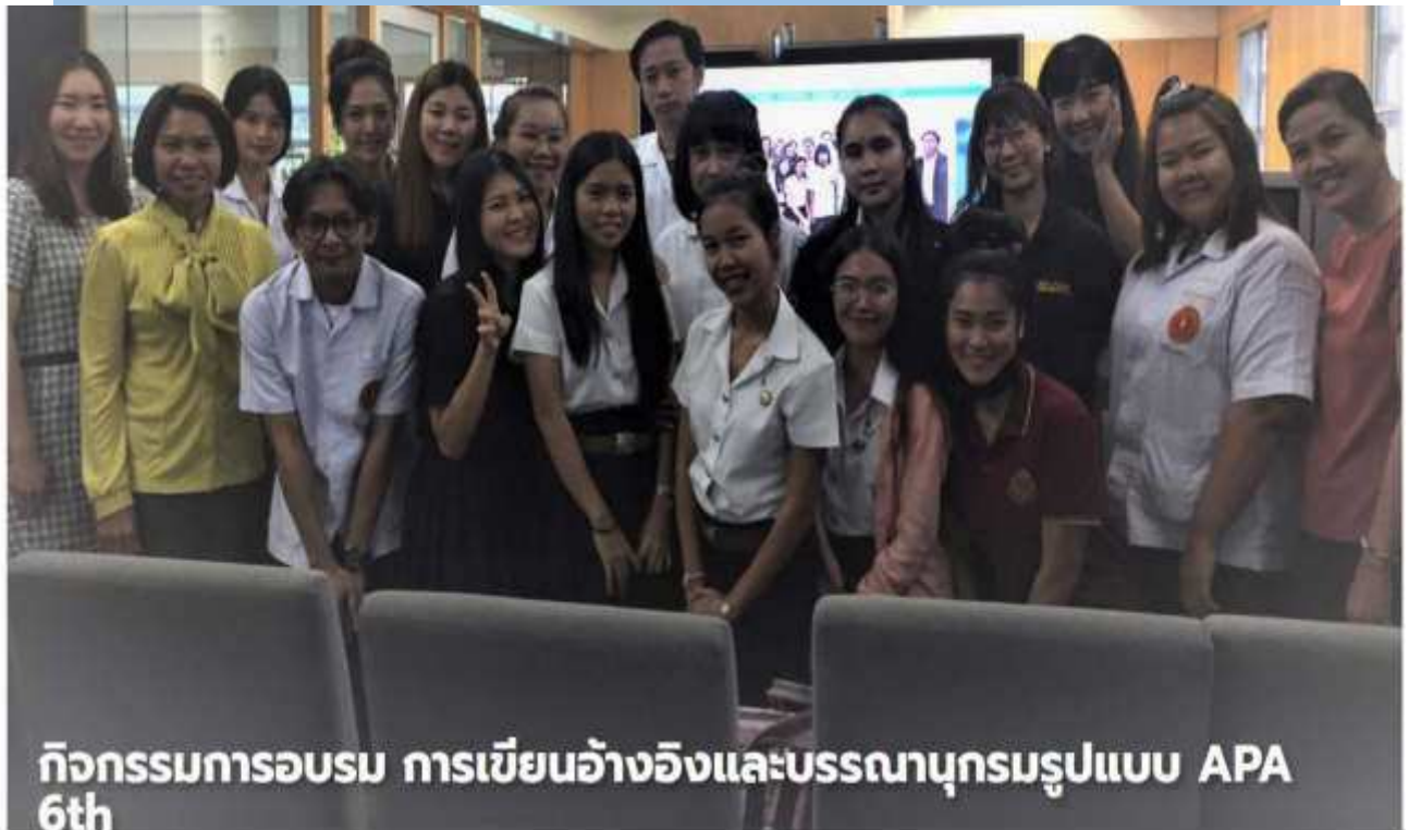
กิจกรรมการอบรม การเขียนอ้างอิงและบรรณานุกรมรูปแบบ APA 6th